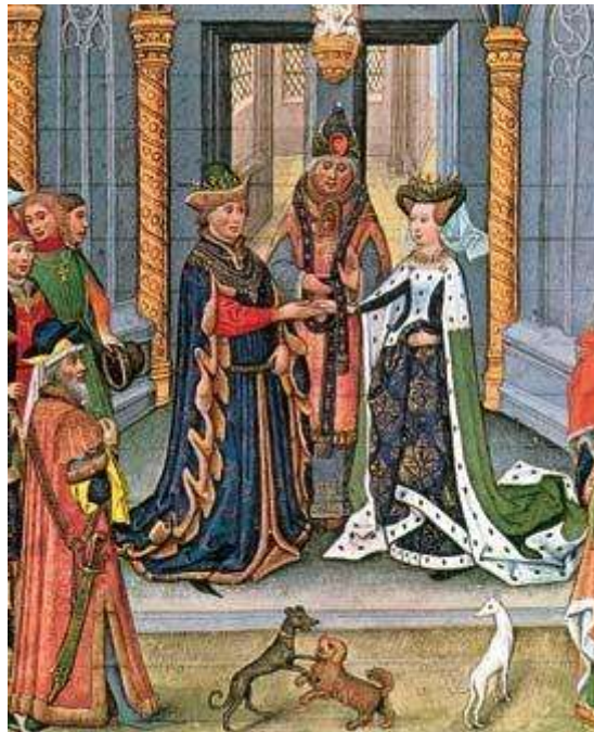
Figura 02. Iluminura retratado o casamento na Idade Média. Disponível em: < http://www.ruadireita.com/outros/info/o-casamento-e-a-familia-na-idade-media/ >. Acesso em 11 out. 2016.

germânica (WALD, 2002, p.13). “Destarte, o casamento é indissolúvel. Isto significa que o Direito Canônico era contra a separação judicial e firmava-se na frase “o que Deus uniu, o homem não separa. Tinha o matrimônio como sacramento.” (LOBATO, 2009, s.p.). Segue a autora, a indissolubilidade se divide em dois tipos, sendo eles, intrínseca e extrínseca, afirma a primeira a impossibilidade do rompimento do vínculo matrimonial, sendo esta defendida pela igreja católica; a segunda refere-se à autoridade pública e admite algumas exceções (LOBATO, 2009, s.p.).