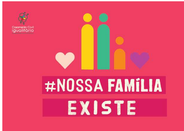
Figura 03. Folder de Campanha Contrário ao Estatuto da Família. Disponível em: < http://pravda-number-five.blogspot.com.br/2014/12/campanha-nossa-familia-existe-criada.html >. Acesso em 14 out. 2016.

familiar. Em adição, os autores fazem referência ao princípio da intervenção mínima do Estado no Direito de Família, mencionando que “ao Estado não cabe intervir no âmbito do Direito de Família ao ponto de aniquilar a sua base socioafetiva” (GAGLIANO; PAMPLONA FILHO, 2014, p.119).