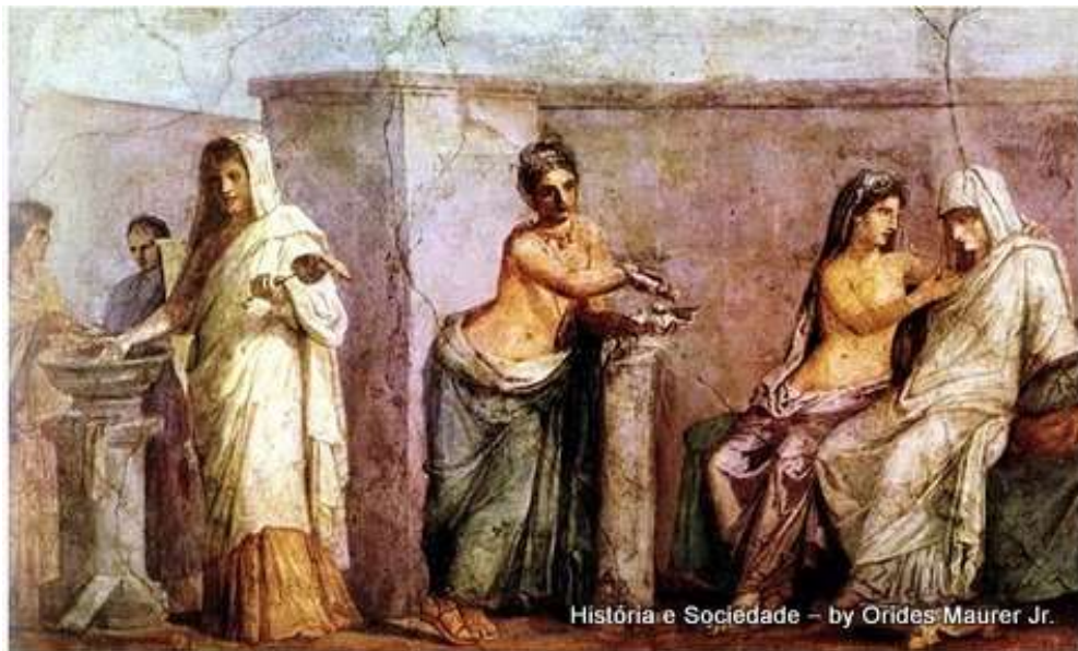
Figura 01. Mosaico retratando as núpcias de Alexandre, o Grande, e a princesa Roxana. Disponível em: < http://oridesmjrblogspot.com.br/2011/11/cultura-de-roma.html >. Acesso em 04 out. 2016.