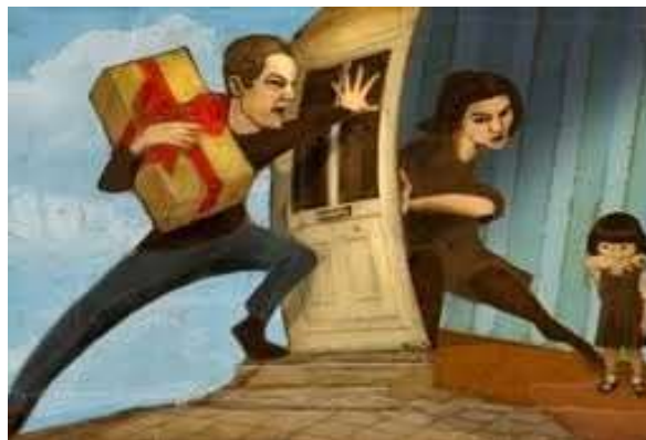
Figura 05. A alienação parental e suas consequências jurídicas. Disponível em: < http://gaumb.jusbrasil.com.br/artigos/139169505/a-alienacao-parental-e-suas-consequencias-juridicas >. Acesso em 23 out. 2016.