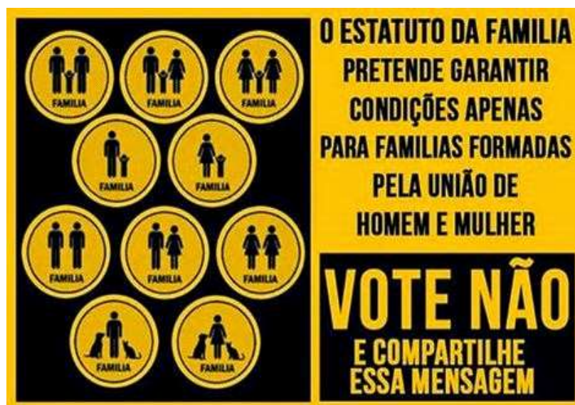
Figura 04. Folder de Campanha Contrário ao Estatuto da Família. Disponível em: < http://pravda-number-five.blogspot.com.br/2014/12/campanha-nossa-familia-existe-criada.html >. Acesso em 14 out. 2016.

Do ponto de vista de Gomes (2013), a partir da Constituição de 1988, a família passou a ser remoldada, com valores mais humanos, fraternos, plurais e igualitários, fundados na dignidade da pessoa humana, a Constituição reconhece a união estável como entidade familiar, referindo-se como convívio público, contínuo e duradouro entre homem e mulher, com o intuito de constituir família (GOMES, 2013, s.p.).