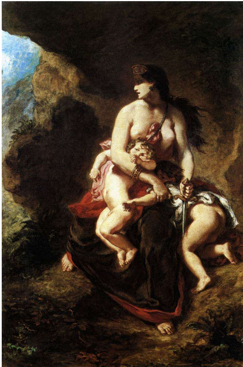
Figura 06. Medeia prepara-se para matar os filhos em óleo de Eugène Ferdinand Victor Delacroix (1825).

de Eetes, rei da Cólquida, princesa nefasta que sem ela, Jasão não teria conquistado o Velocino de Ouro, um talismã que levaria ao auge do poder aquele ao qual pertencesse. Há também tradições que Medéia seria filha de Hécate, a mais tenebrosa das feiticeiras, a irmã de Circe, outra feiticeira tão poderosa quanto sua mãe. A personagem era dotada de uma violência inquieta e do fogo das paixões, mudanças de humor e constante melancolia com um comportamento criminoso que se volta contra aqueles aos quais ela ama (VAZ, 2009, s.p).