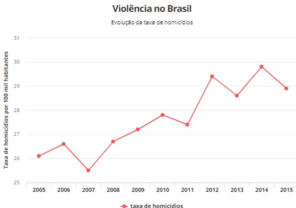
Gráfico 1: Evolução da taxa de homicídios