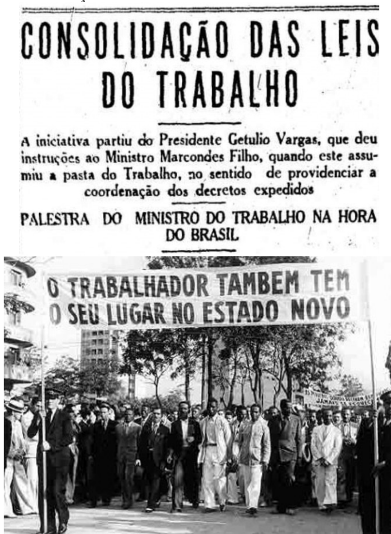
Figura 02: Consolidação das Leis do Trabalho e o Estado Novo de Getúlio Vargas