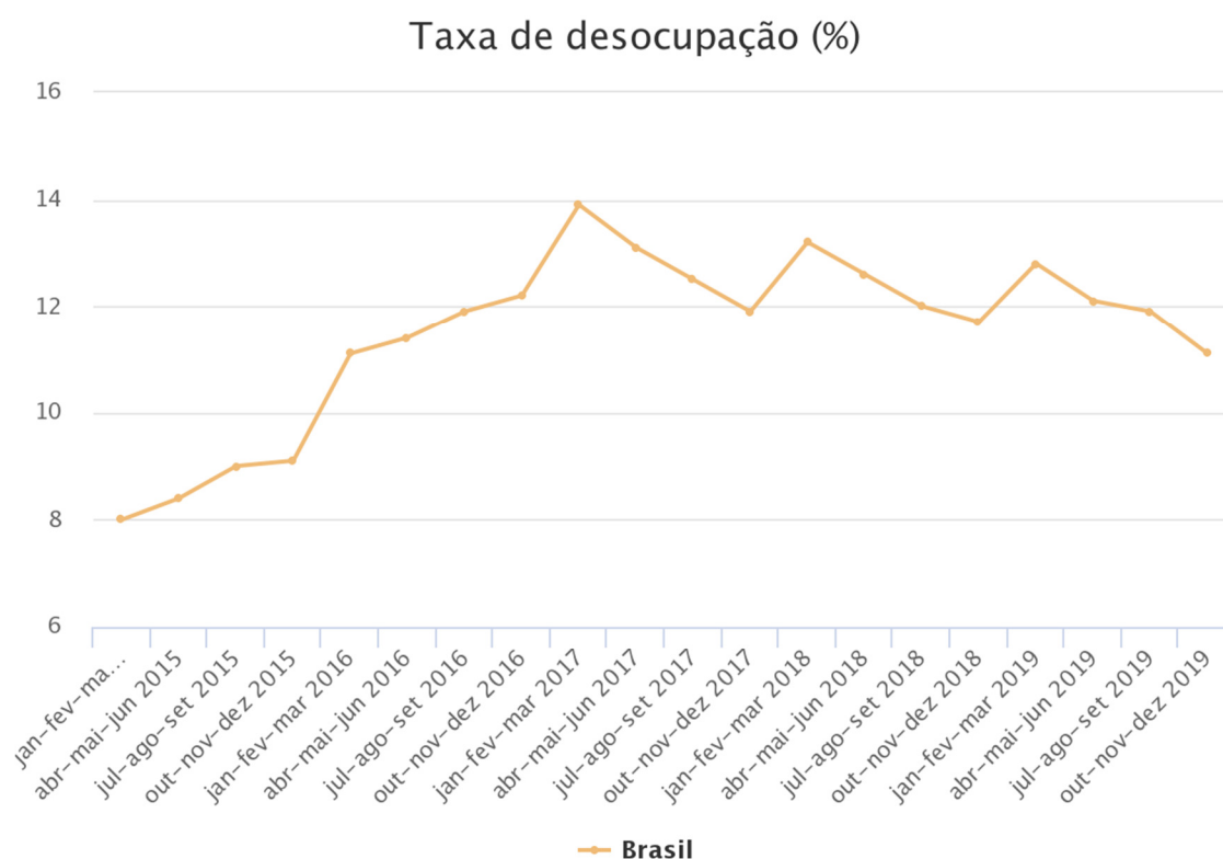
Gráfico 01. Taxa de desocupação no Brasil anos de 2015 a 2019