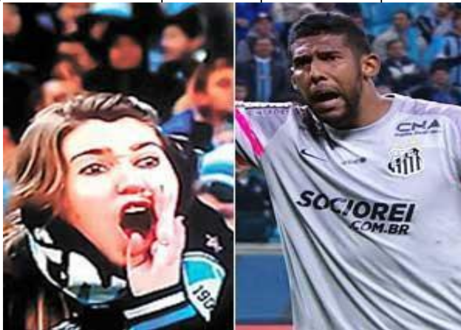
Figura 4. Caso Aranha é o pano de fundo para análise mais profunda.