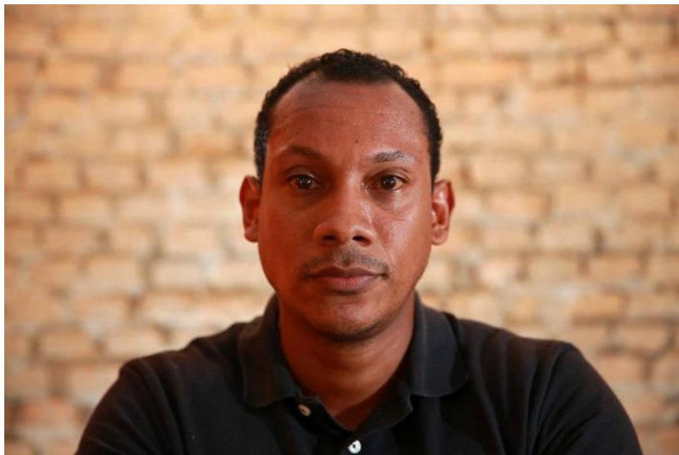
Figura 7. Árbitro apitou Esportivo e Veranópolis na quarta-feira e teve bananas atiradas contra seu carro