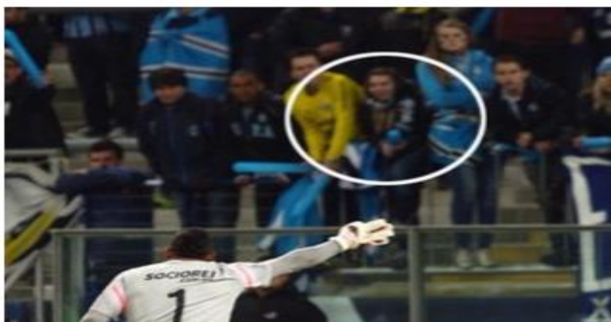
Figura 5. Torcedora foi identificada, nas redes sociais.