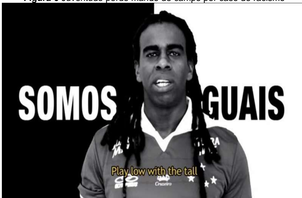
Figura 6 Juventude perde mando de campo por caso de racismo