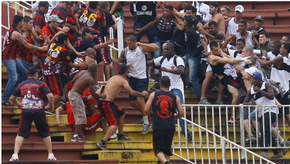
Figura 01. Briga entre torcedores de Atlético Paranaense e Vasco da Gama — Como compreender e combater de maneira efetiva a violência no futebol?

As torcidas organizadas brasileiras são diferentes em muitos aspectos dos hooligans , fazendo com que essa titularidade dada a eles pelos meios de comunicação sejam inapropriadas. Sendo assim, os hooligans, os torcedores organizados são, em sua maioria, homens jovens oriundos das classes “populares” (LOPES; CORDEIRO, 2010).