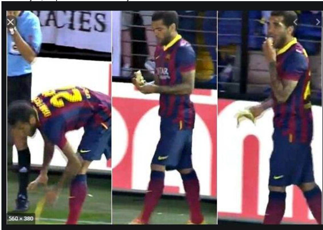
Figura 2. O lateral do Barcelona viu novamente bananas serem jogadas da arquibancada em sua direção; respondeu à demonstração de racismo de forma inusitada: comendo a fruta.