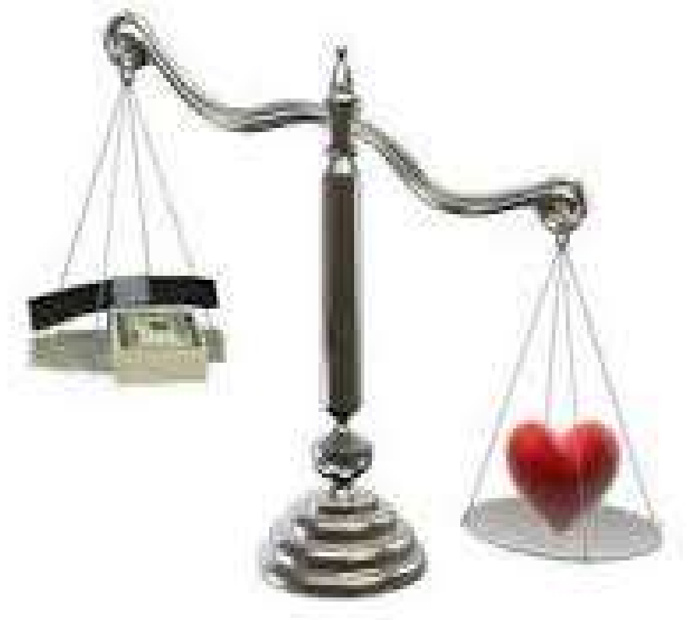
Figura 06. Amor não é obrigatório, mas abandono afetivo de criança gera dano moral (1862). Disponível em: http://raquelprudenteadvocacia.blogspot.com.br/2015/12/amor-nao-e-obrigatorio-mas-abandono.html . Acesso em 16 nov. 2016.

Destarte, verifica-se que o Tribunal afirmou de forma inequívoca que o Judiciário não pode obrigar ninguém a amar, visto não se trata de amor, mas de atenção; não se trata de sentimento, mas de prestar determinada conduta.