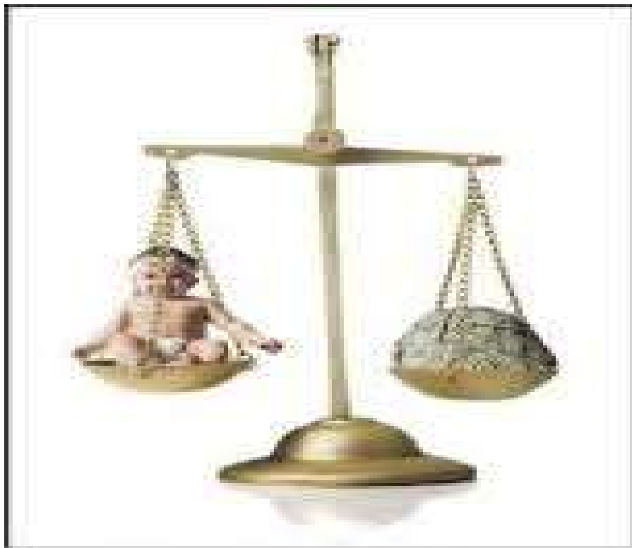
Figura 07. Pai deve pagar R$ 200 mil por abandono afetivo. Disponível em: http://quadrangular-crown.blogspot.com.br/2012/06/abandono-afetivo-pai-condenado.html . Acesso em 17 nov. 2016.

Desse modo entende-se que a finalidade desta proposta é garantir que o genitor tenha a obrigação de cumprir com seus deveres de pai, impostos pela lei, prestando os devidos cuidados para com seus filhos, podendo na falta deles sofrer condenação por abandono moral, arcando com a responsabilidade de tê-lo abandona