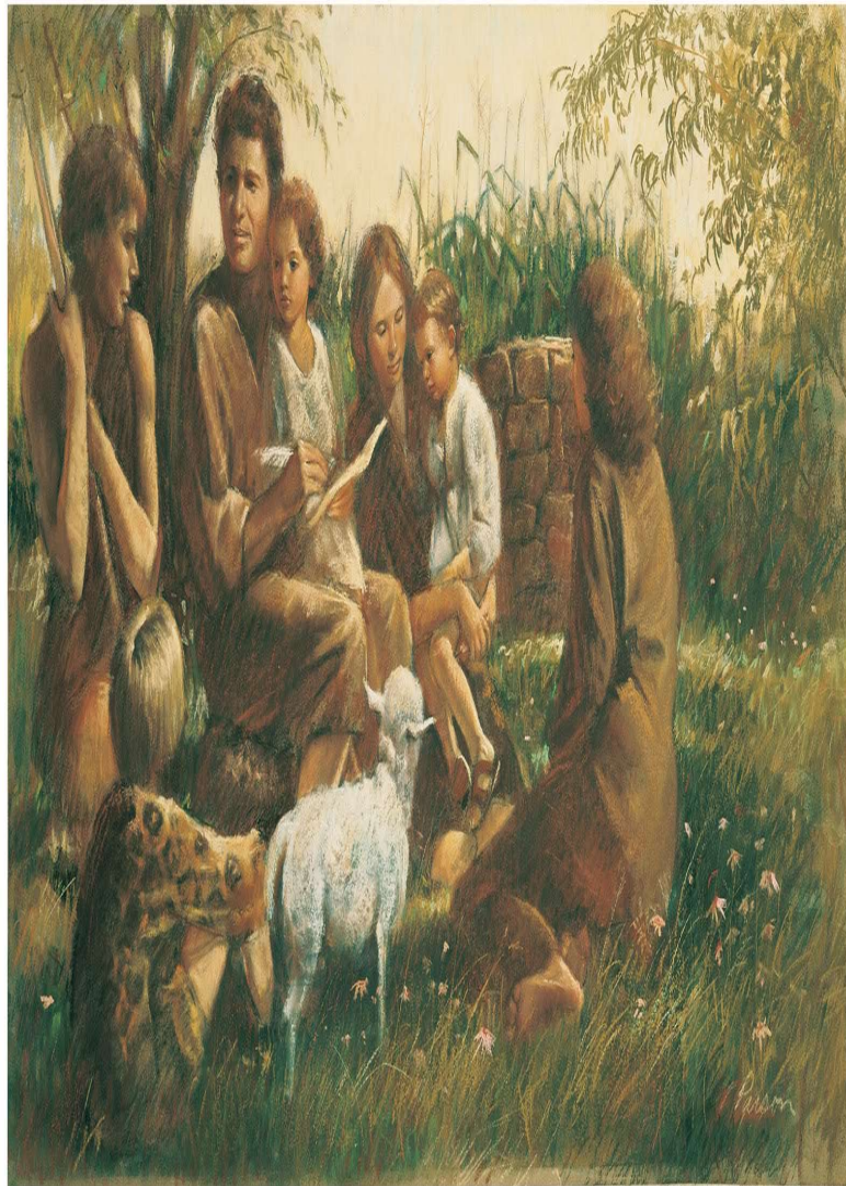
Adam and Eve Teaching Their Children, by Del Parson, © 1978 RRI

Neste texto ele, esclarece que “autoridade do pai para a boa formação da família; tem grande importância, somando a figura materna, possuindo uma influência sobre os filhos, e segundo ele “deixando marca indelével em toda família”