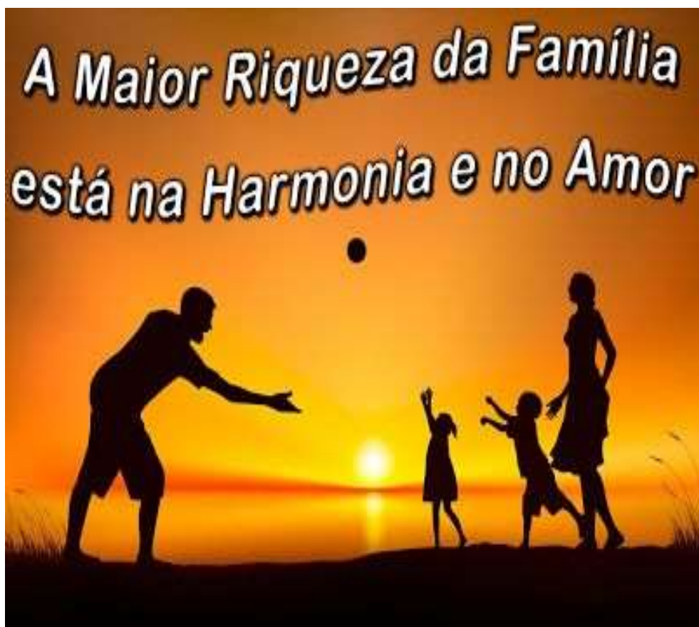
Figura 03. A maior riqueza da família está na harmonia e no amor em: https://parangolenews.wordpress.com/2008/10/15/lei-nao-pune-pais-que-entregam-filhos-a-terceiros/ . Acesso em 17 nov. 2016.

A ausência de afetividade resulta em má formação da personalidade, que causa prejuízos para o próprio indivíduo e para a qualidade de relacionamentos que manterá na vida em sociedade (SANTOS, 2011, p. 115).