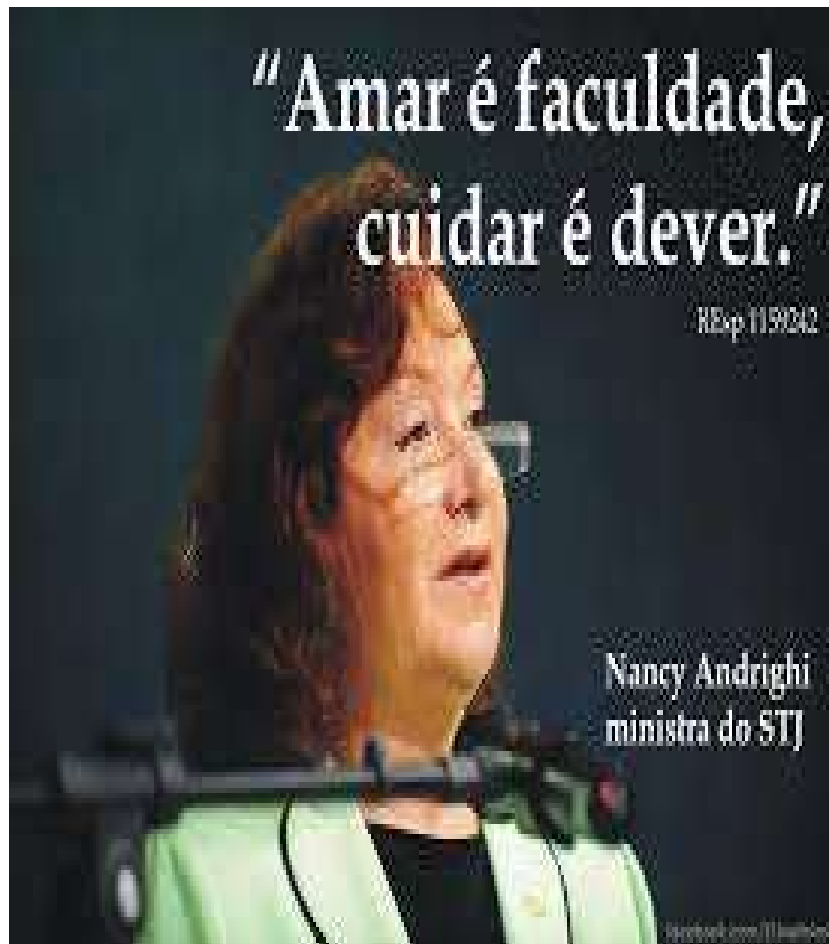
Figura 05. “Amar é faculdade, cuidar é dever”

Há uma intensa crítica na doutrina quanto à aplicabilidade de reparação civil nos casos de abandono afetivo nas relações paterno-filiais. Esse comportamento se deve ao fato de que, as relações familiares não eram resolvidas de tal forma, visto que a própria família resolvia seus problemas.