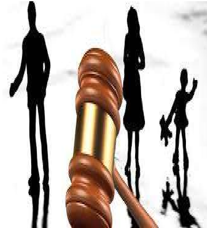
Figura 08. Responsabilidade familiar, abandono afetivo e indenização http://www.henriqueguimaraes.com.br/artigos/responsabilidade-familiar-abandono-afetivo-e-indenizacao/ . Acesso em 17 nov. 2016.

Vê-se claramente que os julgadores ao conceder provimento às ações de reparação civil por abandono afetivo se baseiam no princípio da dignidade da pessoa humana, pela valoração jurídica do afeto.