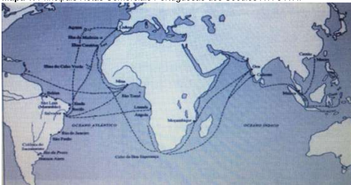
Mapa 1. Principais Rotas Comerciais Portuguesas dos Séculos XVI e XVII