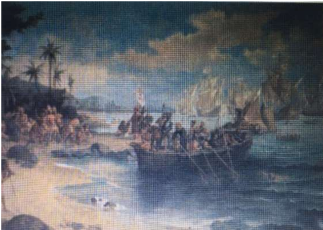
Figura 1. “Desembarque de Pedro Álvares Cabral em Porto Seguro”, de Oscar Pereira da Silva