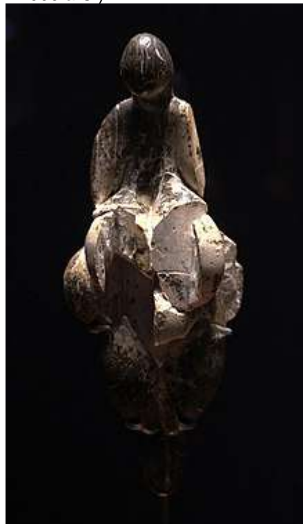
Figura 02. Vênus de Lespugue (26.000 a 24.000 a.C.)