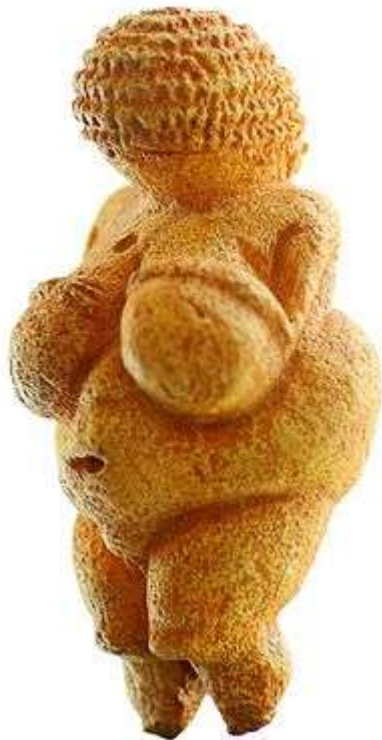
Figura 01. Vênus de Willendorf (28.000 a 25.000 a.C.)