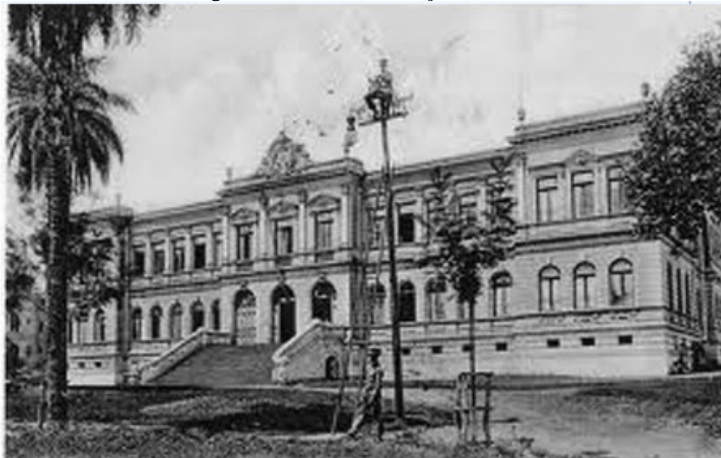
Figura 01. Tribunal de Relação da Bahia

estatuto de independência, pois a autoridade do Estado absoluto monárquico era o rei (CHAVES, 2018, s.p.).