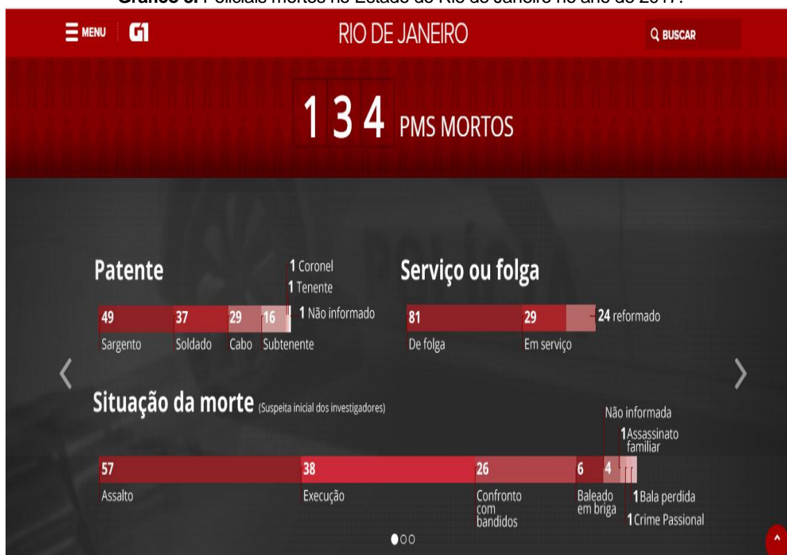
Gráfico 3. Policiais mortos no Estado do Rio de Janeiro no ano de 2017.

Com a aprovação da Lei nº 13.142/2015, o observatório legislativo da intervenção federal na segurança pública do Rio de Janeiro registrou que houve uma redução nas mortes de agentes de segurança pública no estado do Rio de Janeiro no ano de 2017 para 2018. Embora ano de 2017, tenha sido registrado como o ano com maior número de mortes de policias militares, o ano de 2018 demonstra a maior queda nos homicídios contra agentes de segurança pública nos últimos 24 anos. (MENDES, 2020, p.419 apud OLERJ, 2018, online )