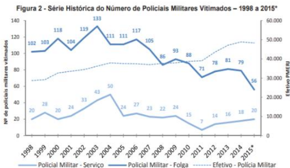
Gráfico 1- Série histórica do número de Policiais Militares vitimados nos anos de 1998 a 2015.

*- Dados de 2015 contabilizados até o mês novembro.